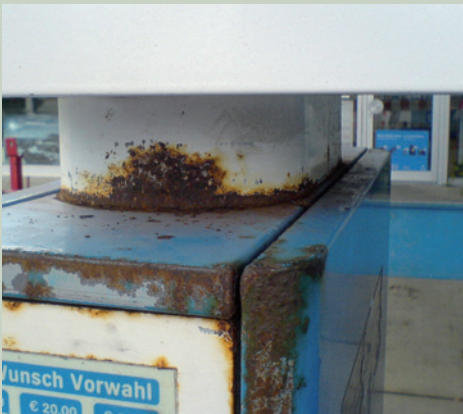
Zapfsäulenlackierung vor Ort